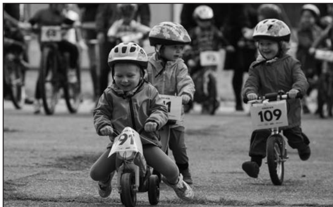
Atmosféru závodů si vyzkoušeli i nejmenší závodníci