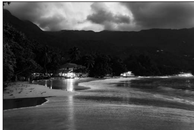
Západ slunce v Beau Vallon.