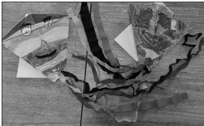
Děti si vyrobily vlastní papírové barevné dráčky.