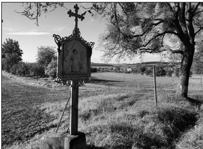
Jedno ze zastavení kvasické Křížové cesty