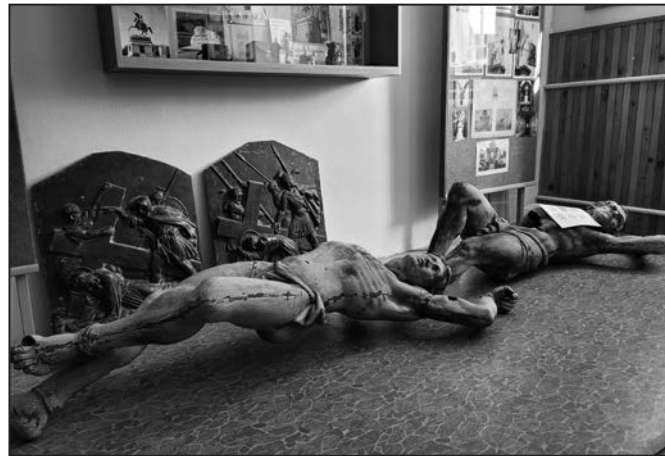
... se aktuálně nachází v kvasickém muzeu