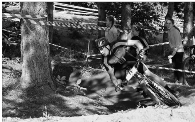
O dramatické okamžiky nebyla nouze.