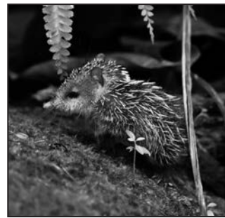
Fauna je rozmanitá, v džungli nechybí ani malý bodlín