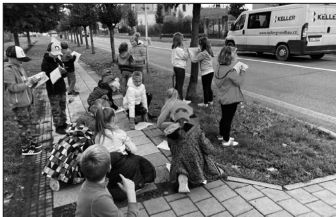
Žáci pečlivě zapisovali každé auto a kolo, které projelo kolem.

Význam Dne bez aut si vysvětlili a ujasnili žáci 2. A a 2. B. Po teoretické přípravě vyrazili sledovat provoz na silnicích ven, konkrétně k přechodu u sokolovny.