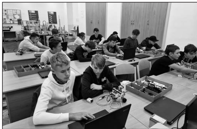
Žáci si vyzkoušeli programování, téma je zaujalo.