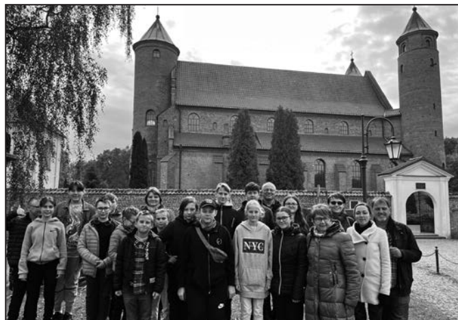
Výprava využila návštěvu i k seznámení s Polskem.