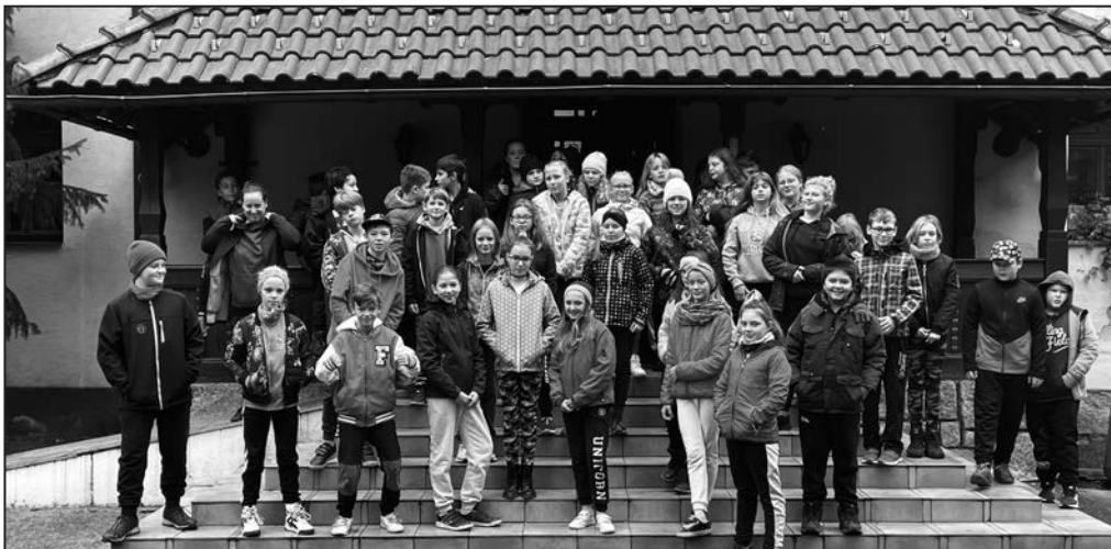
Účastníci kurzu zdolali i pár osmitisícovek.

Na konci našeho dobrodružství jsem se většiny dětí ptala, jak se jim to líbilo. A jejich odpověď? Téměř 100 procent dětí odpovědělo, že je to super a pobyt si chtějí prodloužit. Tomu zbytek se stýskalo po mamince.