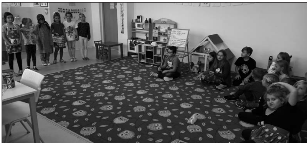
Školní družina nabízí dětem pestrý program.