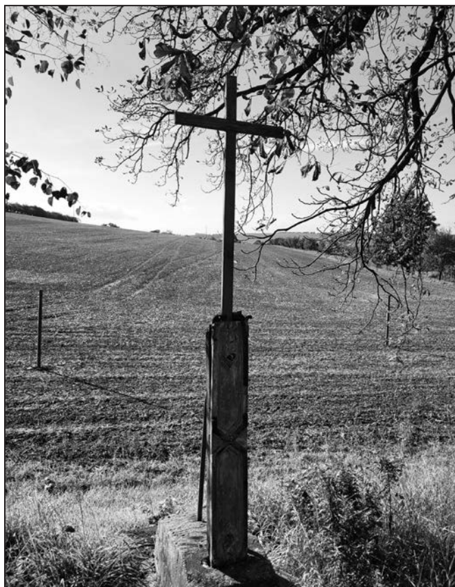
Křížová cesta nutně potřebuje záchranu.

To by nebylo zcela správné a kompletní, protože stávající křížová cesta z roku 1883 je již třetí na tomto místě. První křížová cesta v Kvasicích byla postavena za rekatolizace, po Bílé Hoře, v době, kdy kvasické panství vlastnil rod pánů z Rottalu. Není vyloučeno, že Jan z Rottalu, který zde zahájil rekatolizaci, nechal postavit i první křížovou cestu. Tato nejstarší podoba křížové cesty obnášela sedm kamen-