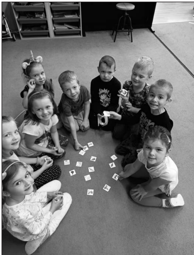
Školka, to je nejen hraní, ale také vzdělávání.