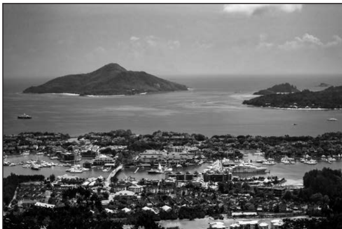
Pohled na hlavní město Victorii a marinu