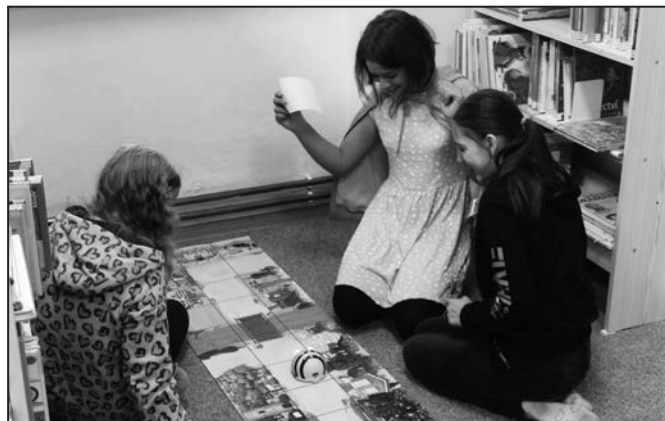
Knihovna se rozvíjí i v oblasti technologií.