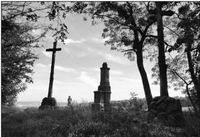
Sousoší tří kamenných křížů, chybějící sochy lotrů...