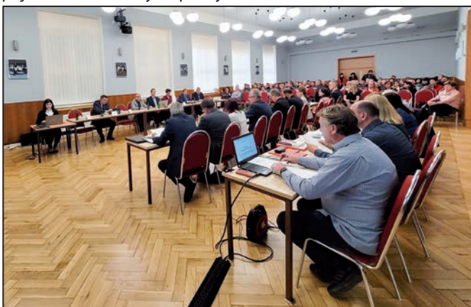
Ustavující zastupitelstvo se uskutečnilo za velkého zájmu veřejnosti.