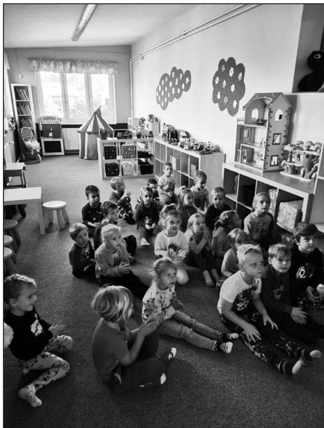
Návštěva z hulínské školky si užila bohatý program.