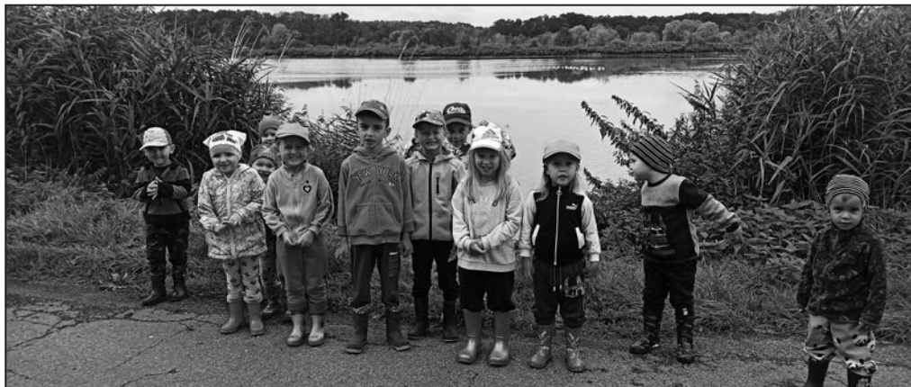
U rybníků děti viděly velké hejno labutí, racků a potápek.

Kromě plodin, které rostou ve volné přírodě, podzim přináší i sklizeň úrody na polích a zahradách. Mezi základní potraviny patří brambory, proto jsme jim i my věnovali pozornost. Všechny činnostmi nás provázal skřítek Bramboráček. Při prohlížení knih a časopisů jsme vyhledávali obrázky týkající se sklizeň brambor. Vyprávěli jsme si o uskladnění a použití brambor v domácnosti. V kuchařce jsme vyhledávali jídla z brambor. Zhotovili jsme si papírové pytle, na které jsme otiskovali brambory. Z pytlů vykládali myšky, které se tam schovaly. Také jsme navlékali kousky brambor a udělali z nich krásné korále pro princeznu. Velký zájem dětí vzbudilo ozdobení skřítky Bramboráčka přírodními. S bramborami jsme si i zacvičili a zazávodili. Počítali jsme je, třídili a řadili podle velikosti. Nezapomněli jsme si