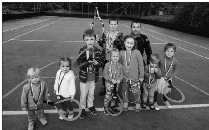
„Baby tenis“, což je sportovní příprava pro děti od tří let.

Silvie Málková Morongová, za rodiče a malé sportovce