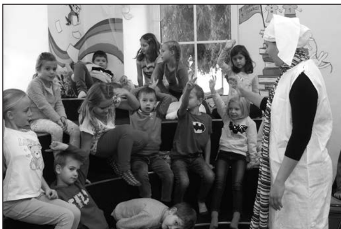
Křemílek s Vochomůrkou přivítali letošní tři třídy prvňáčků.

V letošním roce se uskutečnil již 26. ročník celorepublikové akce Týden knihoven, do které se zapojila jako již tradičně i naše knihovna.