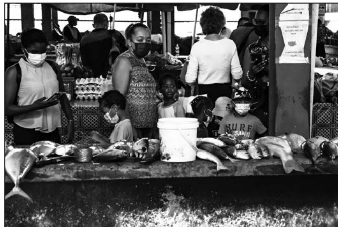
Na trhu uprostřed hlavního města Victoria

Seychely, to jsou samozřejmě hlavně pláže, přičemž řada z nich se pravidelně umísťuje v nejrůznějších top žebříčkách a vlastně je docela jedno, na které z nich se zastavíte. Vždycky na vás bude čekat bílý písek a tyrkysová voda, ve které můžete plavat, šnorchlovat, potápět se anebo pozorovat divoké trnuchy, které z ničeho nic připlavou ke břehům. O tom, že trnuchy mohou být smrtelně nebezpečné, se Linda dozvěděla